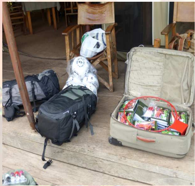
Niños de la escuela de Ositeti leyendo las cartas de niños de España. Material para la escuela.