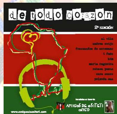
II Edición del CD Solidario.